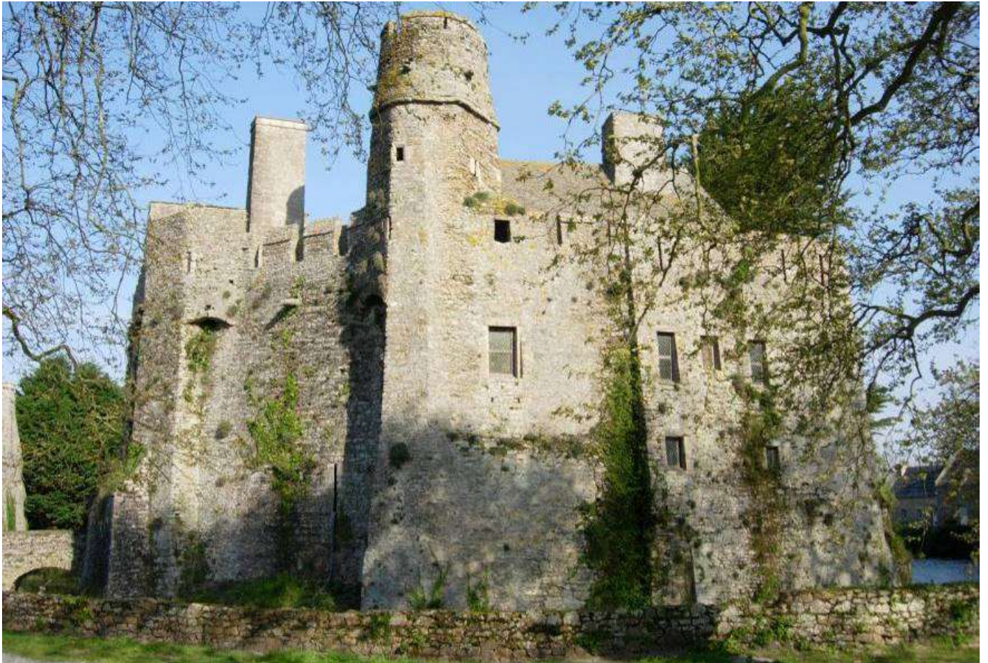
Le Château fort de Pírou