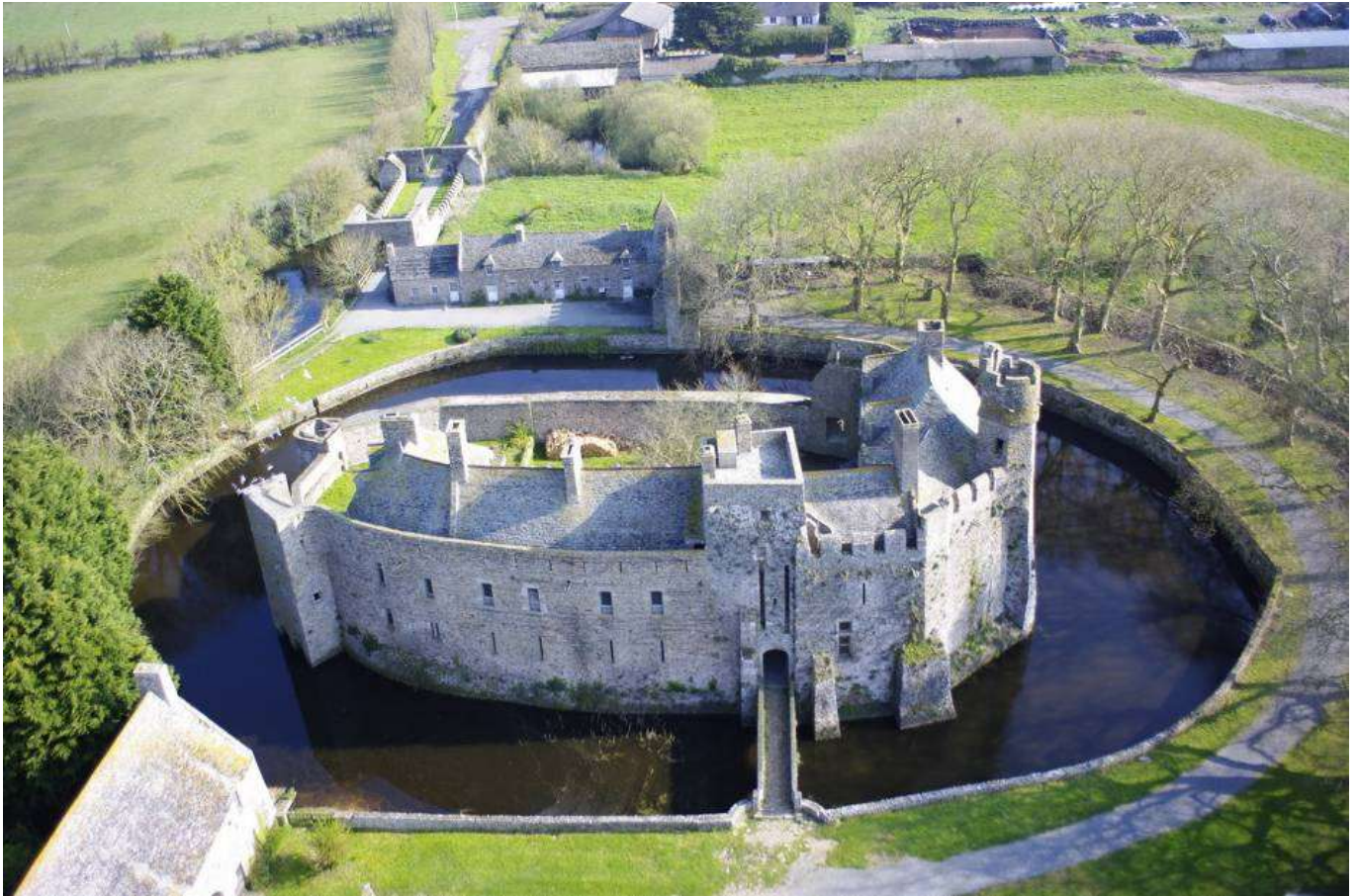
Le château fort de Pirou, (XII e s.), vue du Sud, avril 2008.