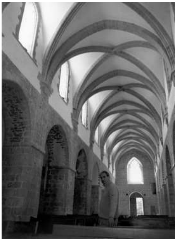
La nef restaurée, 2009