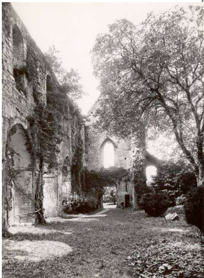
La nef de l'abbatiale v.1950

Nous aider à sauvegarder et restaurer l'Abbaye de La Lucerne et le château fort de Piroou.